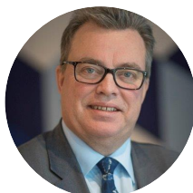
Urban Doverholt Ordförande